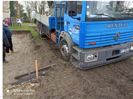
mais plouf dans la rigole